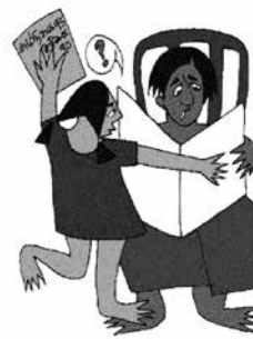
Xâm phạm sự riêng tư của trẻ