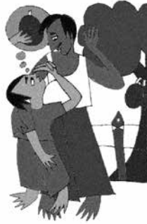
Dụ dỗ trẻ