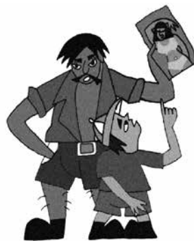
Truyền bá hình ảnh dâm ô hoặc nội dung đồi trụy