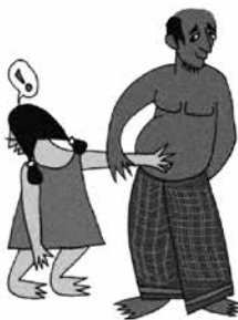
Ép buộc trẻ sờ mó cơ thể mình