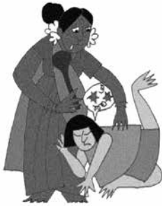
Đánh đập hoặc gây tổn thương cho trẻ