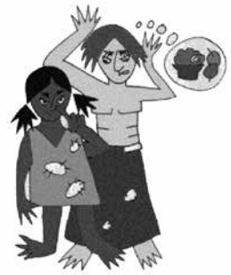
Không chăm sóc trẻ, ví dụ: tắm rửa, thay quần áo, cho trẻ ăn uống