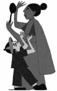
Không lắng nghe trẻ