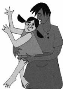
Sờ mó những khu vực nhạy cảm trên cơ thể trẻ