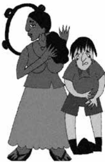
Phớt lờ nhu cầu được chăm sóc sức khỏe của trẻ