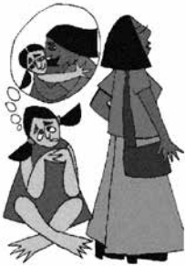
Phớt lờ nhu cầu được yêu thương của trẻ