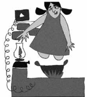
Bỏ bê, không để ý giám sát trẻ