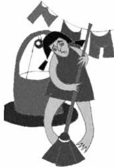
Bóc lột sức lao động ảnh hưởng tới học tập, vui chơi của trẻ