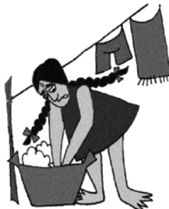
Sử dụng trẻ như một nô lệ