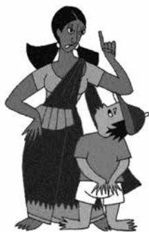
Xâm hại bằng lời nói