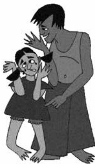
Trêu ghẹo trẻ quá đáng