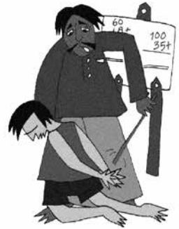
Đánh đập, nhạo báng trẻ trong trường học