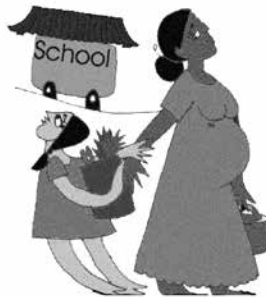
Phớt lờ nhu cầu học tập ở trẻ